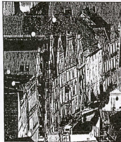
Wismar, St. Georgen: Deutschlands größte Kirchenruine wird bis 2010 wieder aufgebaut.