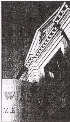
Das Zeughaus ist eine von Wismars Attraktionen.