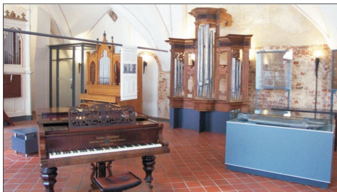
Ausstellung "Klingendes Welterbe" im Stralsunder Rathaus

jeder kennt die braunen Schilder entlang der Autobahn, die auf touristisch interessante Orte aufmerksam machen und zu einem Abstecher einladen. In Mecklenburg-Vorpommern gibt es davon reichlich, denn das Bundesland bietet viele attraktive Kulturstätten. Auf die Hansestadt Stralsund als Teil des UNESCO-Welterbes weisen künftig ebenfalls zwei dieser braunen Schilder hin. Bis Ende Juli werden die neuen touristischen Hinweiszeichen an der Autobahn A20 aufgestellt. Auch an den Ortseingängen zur Stadt tut sich etwas. Die bereits neben der Fahrbahn stehenden Begrüßungsschilder der Tourismuszentrale machen bald auch auf den besonderen Status aufmerksam, den die Welterbestadt Stralsund gemeinsam mit Wismar besitzt.