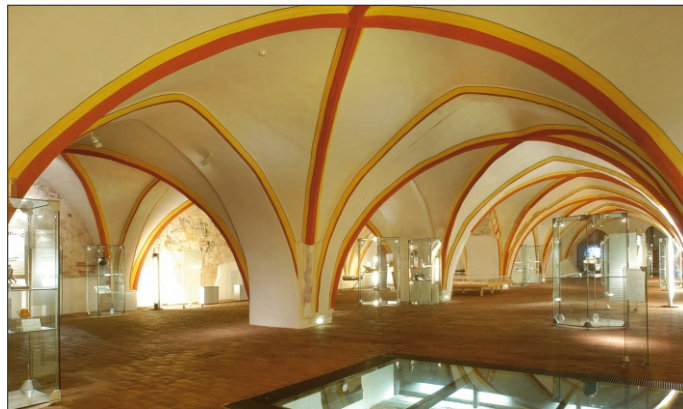
"Bilder einer Stadt" im Rathauskeller in Wismar

eine Welterbestätte hat vielfältige Aufgaben zu erfüllen. Da sind zum einen die Bemühungen um Schutz und Erhalt, zum anderen die Förderung des Welterbe-Gedankens durch aktive Bildungs- und Informationsarbeit. Eine weitere Aufgabe ist es, das Welterbe zu erforschen und die Ergebnisse zu publizieren, um sie der Öffentlichkeit und nachfolgenden Generationen zugänglich zu machen. Erfreulich ist, dass gleich zwei neue Fachpublikationen zur Altstadt Stralsund in den letzten Monaten erschienen sind. Die Broschüre zum Kellerkataster markiert den vorläufigen Abschluss der systematischen Erfassung der Keller im Bodendenkmal Altstadt. Die Reihe "Stralsunder Denkmale" beschäftigt sich im zweiten Heft mit dem Einfluss der Renaissance auf die Stadt. Lesen Sie mehr dazu in diesem UNESCO-Brief.