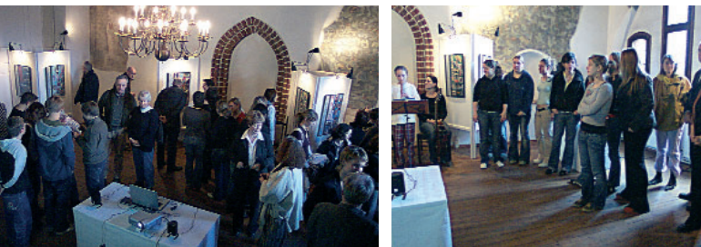
Zur Ausstellungseröffnung im Wulflamhaus kamen zahlreiche Gäste

Eine neue Ausstellungsreihe im Wulflamhaus bietet den Schulen der Hansestadt Stralsund die Möglichkeit, ihre vielfältigen Projektarbeiten zum Thema „UNESCO-Welterbe“ der Öffentlichkeit vorzustellen. Den Anfang macht eine Präsentation der UNESCO-Projektschule IGS Grünthal mit Plakaten von Schülern der 12. Klasse zum Thema „Stralsund-Weltkulturerbe“, die am 5. April 2006 feierlich eröffnet wurde. Zu sehen sind die Arbeiten im Vorraum zum Festsaal des Wulflamhauses täglich von Montag bis Freitag zu den Bürozeiten des Welterbe-Managements von 8.00 Uhr bis 17.00 Uhr.